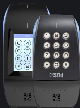
Disponible en versions clavier et écran tactile